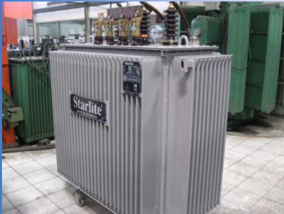
Trafo step up, step down maupun trafo stabilizer tegangan berbagai merk dan kapasitas