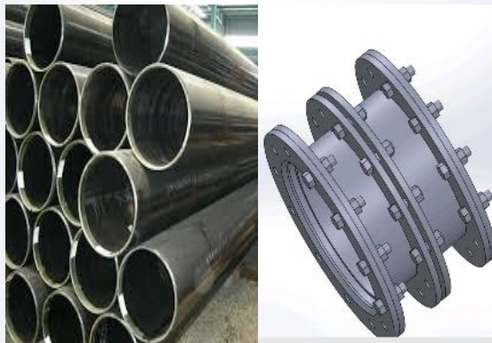
Pipa penstock dari plat besi berbagai ukuran, expansion joint dan flange untuk sambungan pipa