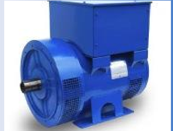
Generator sinkron berbagai merk dan kapasitas. Baik tipe Brushless AVR maupun Brush.

Kami menyediakan berbagai macam komponen sipil, mekanikal, elektrikal, spare parts yang berkaitan dengan PLTMH maupun bidang umum