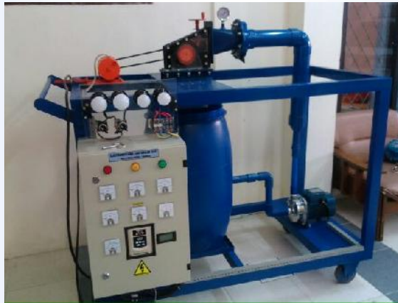
SPESIFIKASI SIMULATOR PLTMH :

Simulator PLTMH merupakan versi mini dengan output AC. Dapat mendemonstrasikan prinsip kerja dan sistem secara lengkap, Sangat cocok digunakan untuk laboratorium mini pada sekolah kejuruan atau perguruan tinggi. Dilengkapi instrument flow meter dan pressure gauge serta sistem pengukuran kelistrikan.