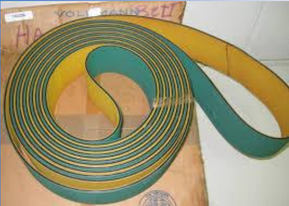
Plat belt merk Habasit maupun Siegling untuk spare part