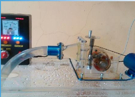
SPESIFIKASI MODEL PLTMH :

Model PLTMH merupakan versi lebih kecil dari simulator. Model ini tidak dilengkapi alat pengukuran dan simulasi seperti model simulator. Output yang dihasilkan adalah DC dan hanya mampu menyalakan beban LED saja. Bentuknya yang kecil sangat cocok untuk display di kantor atau keperluan pameran.