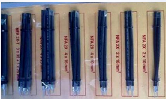
Kabel twisted untuk jaringan TR maupun tipe kabel lainnya untuk instalasi dan power