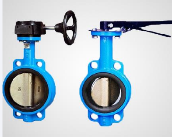
Butterfly valve & gate valve berbagai ukuran dan merk